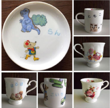
写真はイメージです